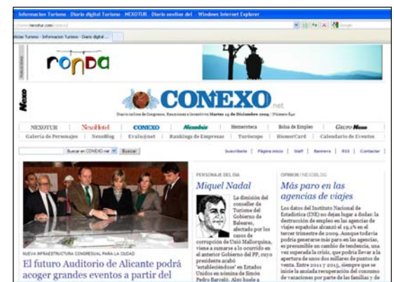
El diario on line Conexo.net

Diario on line, especializado en la organización de congresos y otros eventos con un promedio de más de 45.000 visitas mensuales y desde el que se enlaza los otros diarios on-line