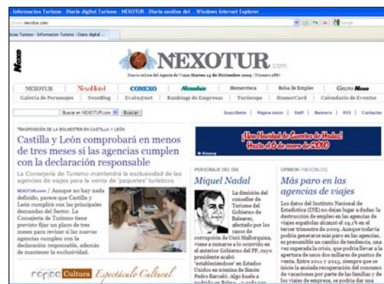
El diario on line Nexotur.com

Diario on line para el Agente de Viajes con un promedio de más de 50.000 visitas mensuales. Desde él se enlaza a otros diarios on line del Grupo Nexo como Conexo, Nexohotel o Nexobus